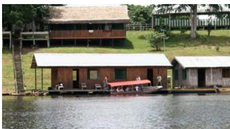
Campen, med husbåtarna vid vattnet

Så kom vi fram till Pousada Boca do Juma längs River Mamori/Lake Juma, vår bas under dessa dagar. Denna camp var byggd som alla andra ställen längs floden, dvs. med husen en bit upp så att de klarar det höga vattenståndet under regnperioden och med husbåt nere vid vattnet. Våra husbåtar rymde bostäder åt personalen och en matsal för oss alla.