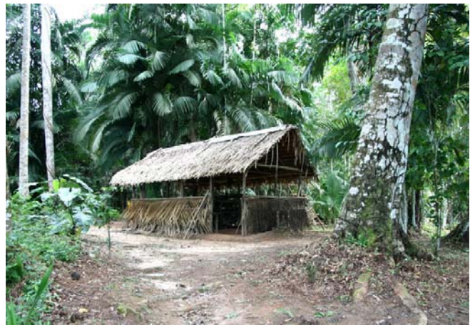
Den lilla verkstaden där tillverkningen skedde

Det var också tack vare dessa pengar man gjorde sådana stora satsningar i staden Manaus. Baronerna var ju alla Européer och ville gärna behålla sin kultur även här ute i djungeln. Så kom det sig att alla dessa byggnader, med Teatro Amazonas i spetsen, lät uppföras i Manaus. Största marknaden för gummi var i Asien och det var där köparna fanns. Alla har vi väl hört historien om hur en engelsman tog med sig frön från gummiträdet och att man planterade dessa i Asien, efter att ha misslyckats i England, och hur sedan hela gummi-produktionen så småningom flyttades dit. Gummibaronerna flydde till Europa och kvar blev slavarerna som inte hade några möjligheter att ta sig någonstans. De bosatte sig runt Manaus som därmed fick en massa förorter och sedan växte till den storstad den är idag.