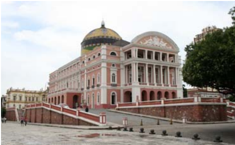
Teatro Amazonas låg bredvid vårt hotell

Det finns förstås flera stora, pampiga kyrkor men det mest originella är Teatro Amazonas. Ett ståtligt operahus, byggt av material som skeppats hit från Europa alternativt av material härifrån som först skickats till Europa för bearbetning. Här syns bland annat kolonner av italiensk carraramarmor, gjutjärn från England, ljuskronor med venetianskt glas, keramik från Alsace, sten från Portugal och brons från Frankrike. Alla de vackra träfåtöljerna i teatersalongen är tillverkade i Europa av brasiliansk jakaranda.