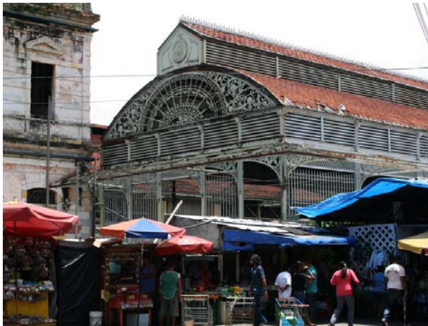
Den gamla saluhallen

Man tog i ordentligt och byggde 1902 en stor saluhall nere vid hamnen, Mercade Adolfo Lisboa, konstruerad av ingen mindre än Gustave Eiffel och helt i stil med "Les Halles" i Paris. Denna är dag i mycket dåligt skick, den ser ut att kunna rasa och handlarna har flyttat ut på utsidan.