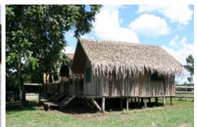
Stugorna, "private suite"