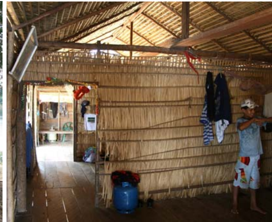
...som bestod av två rum och kök

Denna familj tillverkade också fina smycken som vi förstas handlade. Vi fick också besöka deras bostad som, med våra mått, var väldigt enkel men prydlig. Familjen gav ett välmående intryck och verkade trivas med sin tillvaro. En av de vuxna sönerna hade återvänt efter skoltiden och levde åter med familjen. Han är en duktig jägare och var den som fick gå ut på jakt i djungeln om man inte fått någon fisk då man vittjade morgonens nät vid lunchtid.