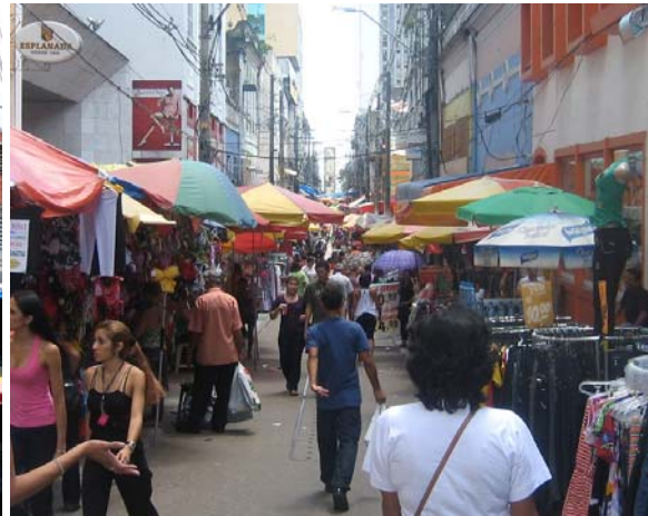
Stånd kantade alla gator i centrum