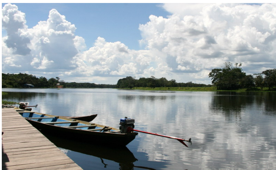
Vy från vår brygga vid River Mamori/Lake Juma