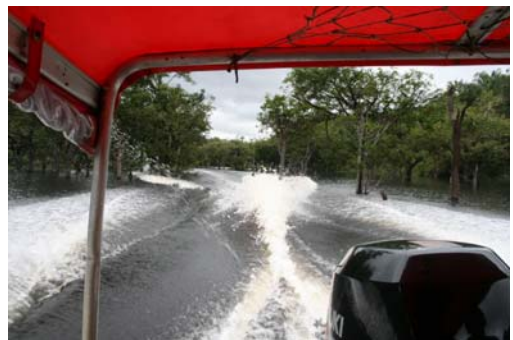
I speedboat mellan träden

Vi åkte minibuss och färdades på land en timma för att slutligen byta till ännu en speedboat och åka en timma på mindre floder. Regnperioden är nu igång och vattenståndet var ca 5 meter över torrperiodens nivå så många, många träd stod mitt ute i vattnet. Som mest kan det skilja 12 meter mellan torr- och regnperiod och det syns en tydlig rand på träden var vattennivån var senaste regnperioden. Här for vi fram i 40-50 knop, ibland i slalom mellan träden.