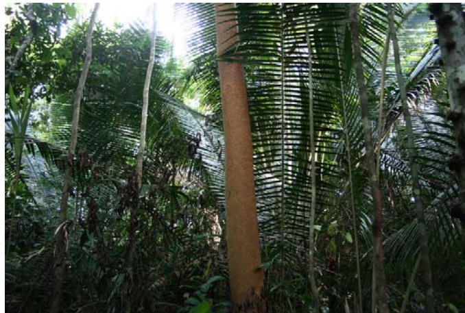
Mahognyträd framför typiska djungelväxter som strilar ljus