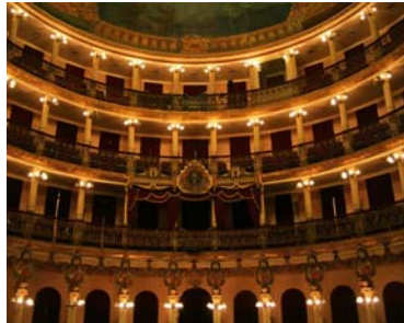
Teaterhallen med sina loger