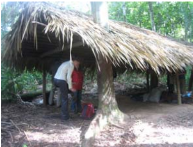
Vi skulle få tak över huvudet!