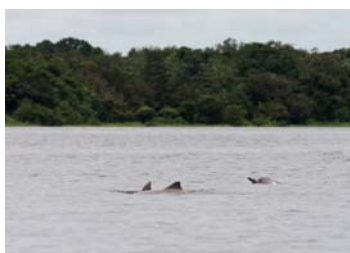
Delfiner simmade förbi ibland