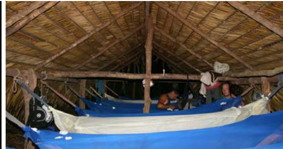
Bäddat och klart!

Morgonen startade med frukostbestyr, ägg och kaffe kokades över elden som vi sedan åt tillsammans med bröd vi haft med oss och färsk ananas, innan vi åter packade ihop allt.