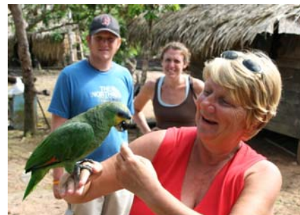
Husdjur hos familjen vi besökte

Den familj vi besökte hade 11 barn, det yngsta var nu 10 år. De äldre hade flyttat till Manaus för den skola som finns här är bara för barn upp till 14 år. Det finns en hel del familjer boende längs floderna och en skolbåt hämtar upp barnen varje vardag utom under lov och torrperioden då vattnet inte räcker för att köra båten på. De barn som bor längst bort blir hämtade redan klockan 05.00 för skolan pågår 07-11 för de yngsta