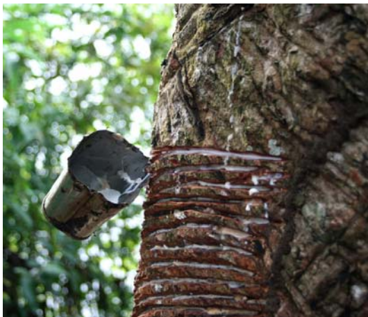
Gummi tappas från trädet

Ett riktigt hantverk! Riktigt spännande blev det när Alan berättade om gummiboomen i Amazonas. Det var sådana pengar inblandade under denna tid så man kan nog inte förstå vidden av det, men man jämför med guldruschen i Kalifornien. Och då bedrevs arbetet inte rationellt med stora plantager med gummiträd utan dessa stod lite här och där i djungeln. Arbetet utfördes av slavar och då gummit är temperaturkänsligt skedde det bäst nattetid vilket innebar att många dog ute i djungeln. Gummibaronerna tjänade sådana enorma pengar att de både köpte sina kläder från Europa och lät sända sin tvätt dit!